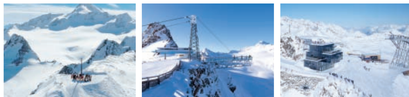
BIG 3 – SCHWARZE SCHNEIDE (3.340 m) | BIG 3 - TIEFENBACHKOGEL (3.250 m) | BIG 3 - GAISLACHKOGEL (3.048 m)

BIG 3 - drei mit modernsten Seilbahn-Anlagen erschlossene Skiberge im Skigebiet von Sölden – allesamt Dreitausender. BIG 3 – das sind der Gaislachkogel (3.048 m), Tiefenbachkogel (3.250 m) und Schwarze Schneide (3.340 m) – drei Skiberge, drei unterschiedliche Aussichtsplattformen und drei einmalige Panoramen im XXL Format. Auf einen Nenner gebracht, sind die BIG 3 Erlebniswelten, die Maßstäbe setzen und stellvertretend für neue Perspektiven im Tourismus stehen.